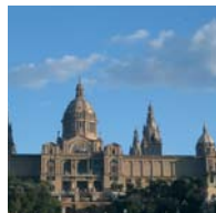
Catalogne - Barcelone