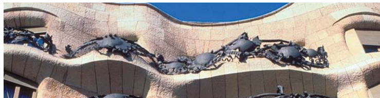
Catalogne - Barcelone