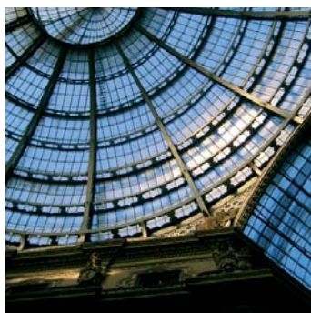
Lombardie - Milan

L'enchevêtrement des compétences entre les différents acteurs et l'abondance des réseaux intermédiaires rendent particulièrement difficile la recherche d'effets levier pour améliorer globalement la qualité, la lisibilité et l'accessibilité des services d'orientation et de conseil aux usagers. La mutualisation d'expériences est également peu développée.