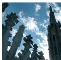
Lombardie - Milan