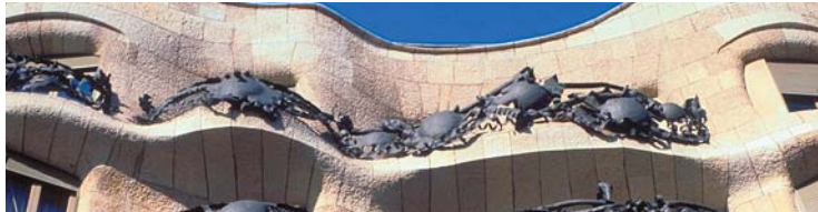
Catalogne - Barcelone