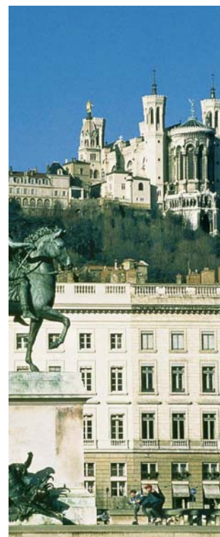
Rhône-Alpes - Lyon