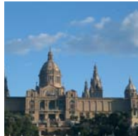
Catalogne - Barcelone